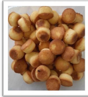
amandelcake natuur 500g € 5,50