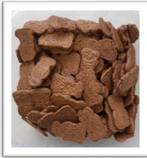
speculoos mini natuur 400g € 5,50

Aangezien we deze artisanale koeken met of zonder overheerlijke chocolade lanceren, houden we de winstmarge gering. Profiteer ervan!