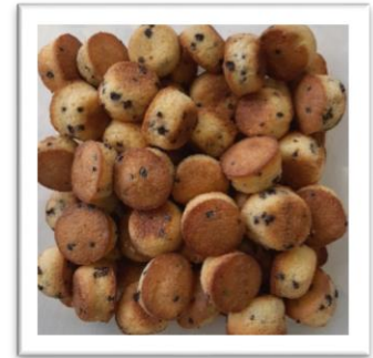
amandelcake chocolade 500g € 5,50