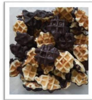
vanillewafel mini chocolade 400g € 6,50