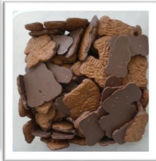
speculoos mini chocolade 500g € 6