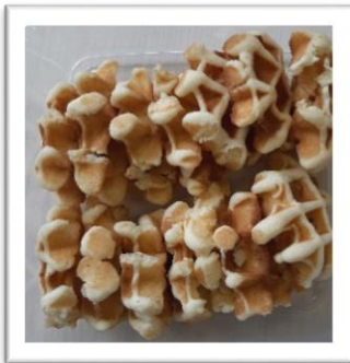
boterwafels 12 stuks € 5,50